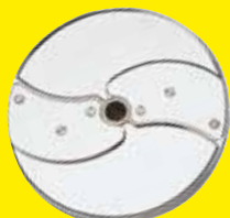
Plátkovač 1 mm Ref. 28062