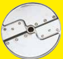
Krájač rezancov 4 x 4 mm Ref. 28052