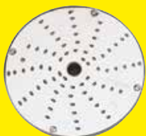
Strúhač 1,5 mm Ref. 28056